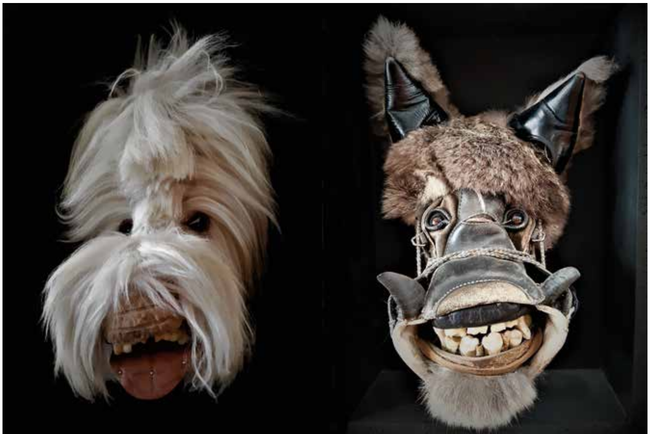
Aus der Reihe "Schuhcharakterköpfe": Yeti, 2022, Materialcollage, 60 x 40 x 20 cm • Wolfseber, 2013, Materialcollage, 42 x 30 x 12 cm From the series Shoe Character Heads: Yeti, 2022, material collage, 60 x 40 x 20 cm • Wolf's Boar, 2013, material collage, 42 x 30 x 12 cm