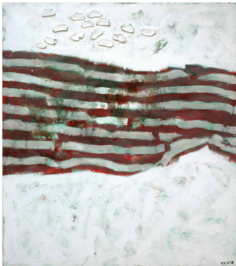
Amerika, 2008, Acryl auf Leinwand, 180 x 160 cm America, 2008, acrylic on canvas, 180 x 160 cm

Kuczma's main interests lay in painting, drawing and performance. He believes that painting comprises the world of the spirit, the inner circle and the existence beyond the reality of the physical world. Performance Art, for him, stands for a reaction to the dirty world of politics, masterminded by the saints of an unforgettable morality. *1956 in Bydgoszcz. 1977–1982, studied Painting and Graphic Art at the Academy of Fine Arts in Gdańsk, degree under Prof. Kazimierz Śramkiewicz. Numerous individual and group exhibitions in Poland, the US, Denmark, Lithuania, Slovakia, Ukraine, Iraq, Germany, the Netherlands, Greece, Romania and Albania. He has curated various exhibitions, such as Contemporary Art of Albania, Germany and the Netherlands, "David Lynch" in Bydgoszcz, "Marina Abramović" in Toruń, "Władysław Hasior" in Bydgoszcz. He was Director of the Municipal Gallery BWA in Bydgoszcz (2002–2016), Director of the Centre of Contemporary Art in Toruń (2015–2020) and at present, he is Director of the Regional Museum in Bydgoszcz. He is also a lecturer on painting at the Department of Design of the Bydgoszcz University of Science and Technology.