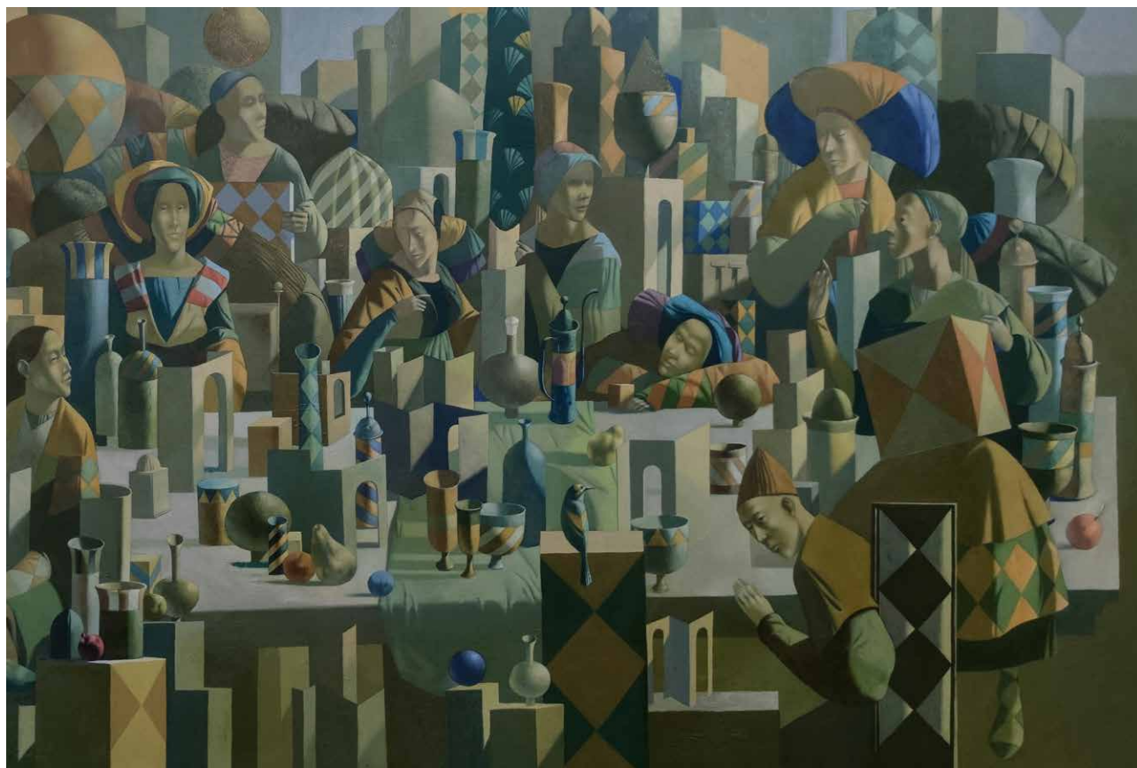
Meditation in der ewigen Stadt, 2022, Öl auf Leinwand, 90 x 180 cm (Detail)

Meditation in the eternal city, 2022, oil on canvas, 90 x 180 cm (detail)