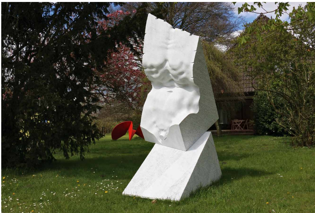
Echo der Antike , 2015, Carrara Marmor, 285 x 190 x 110 cm (Entstanden auf dem NordArt-Symposium 2015) Echo of the Ancient , 2015, Carrara marble, 285 x 190 x 110 cm (Created at the NordArt Symposium 2015)

*1953, in Bulgaria. An MA from National Academy of Fine Arts, Sofia. Diploma, Academy of Fine Arts, Carrara, Italy. 1979–94, Prof. for Sculpture, Academy of Fine Arts, Sofia. 2000–01, Prof. for Sculpture, Academy of Fine Arts, Carrara. 2007–09, Lectureship, Academy of Fine Arts, Sofia. Memberships: Society Piemonte Arte, Turin, Italy; Royal British Society of Sculptors ARBS, London; International Association of Art UBA, UNESCO; Artists Union CarrArte, Italy; Artists Union ASART, Pietrasanta, Italy. Winner of more than 20 international prizes for sculpture. NordArt Prize 2012. Numerous participations in international sculpture symposia, exhibitions and biennials worldwide. Numerous works in permanent exhibitions and private collections (selection): Sculpture Park Gallery, Shanghai; Tsinghua University, Beijing; Rose Garden Park, Taipei; Yuzi Paradise, Guilin; National Art Gallery, Sofia; Stone Museum Hualien. Monumental sculptures in public places (selection): Sofia, Berlin, Milan, Malta, Vermont, Beverly Hills (NJ), Istanbul, Dubai, Abu Dhabi, Wuhu, Urumqui, Qingdao. www.filinart.com