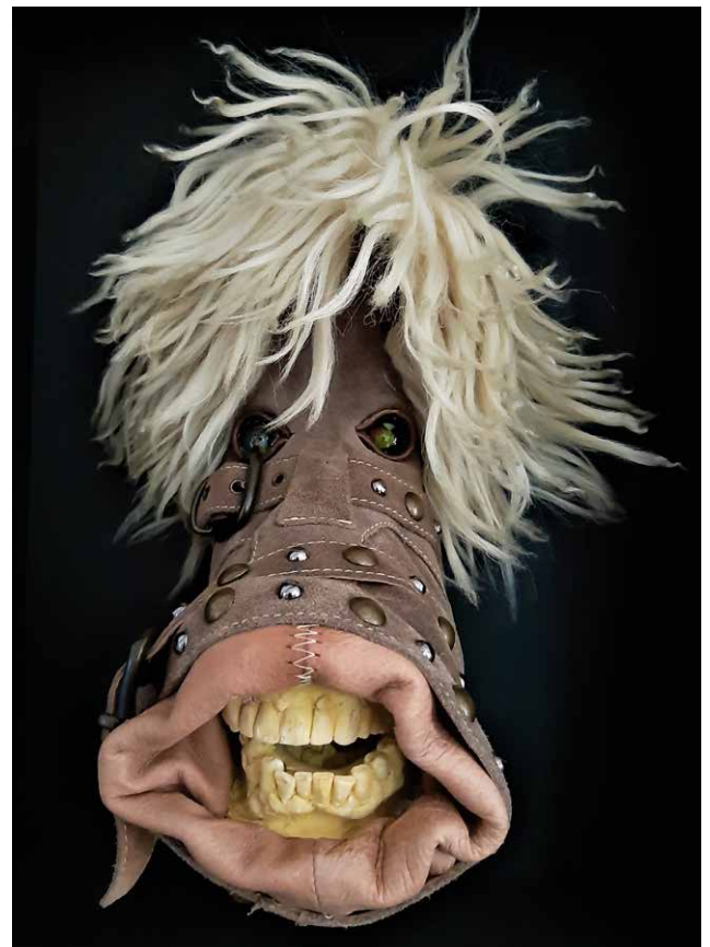
Aus der Reihe "Schuhcharakterköpfe": Pharao, 2014, Materialcollage, 55 x 44 x 12 cm • Ross, 2021, Materialcollage, 42 x 30 x 12 cm From the series Shoe Character Heads: Pharaoh, 2014, material collage, 55 x 44 x 12 cm • Ross, 2021, material collage, 42 x 30 x 12 cm