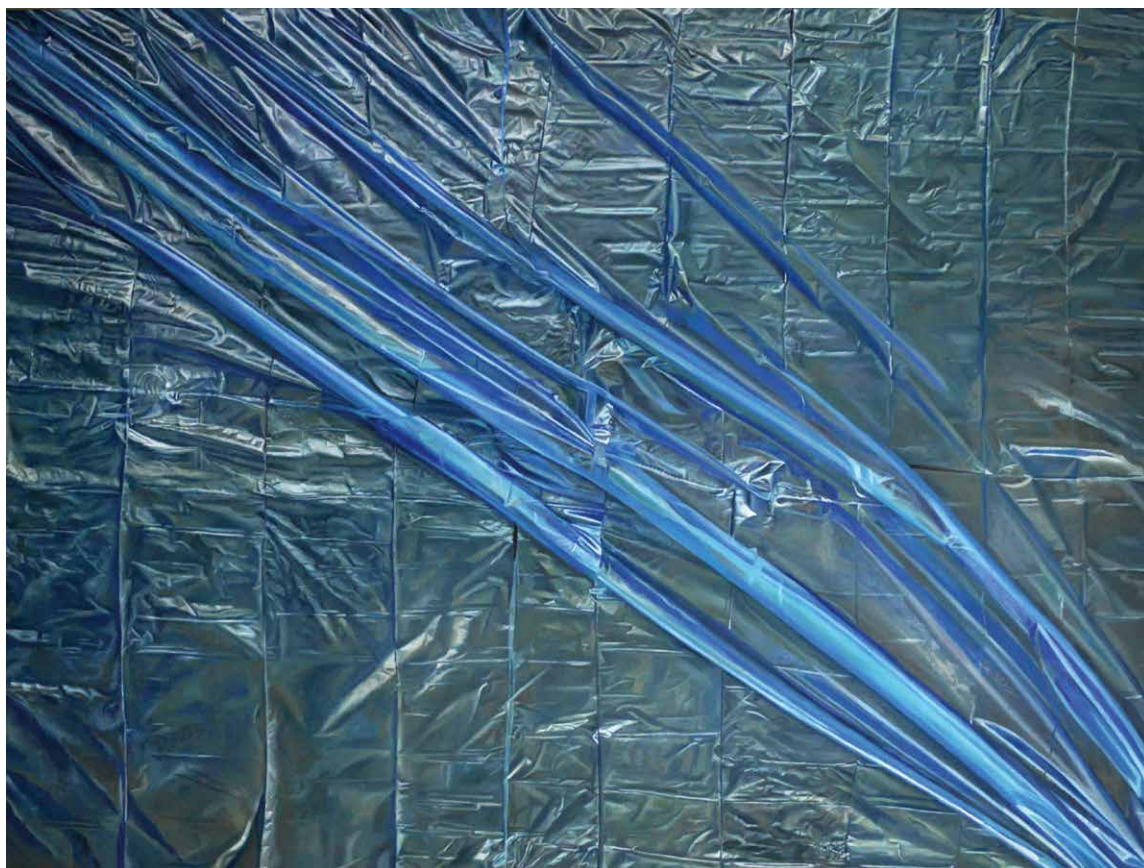
Welle I , 2021, Öl auf Leinwand, 120 x 160 cm

Wave I , 2021, oil on canvas, 120 x 160 cm