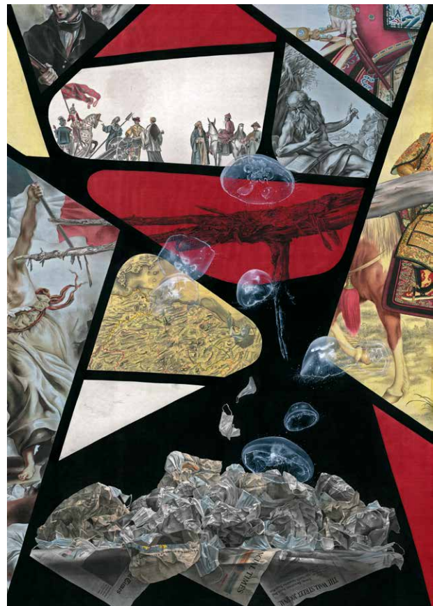
Schnitte der Erfahrung Nr.2–Nr.3, 2021, Farbe auf Seide, je 166 x 116,7 cm Slices of Experience No.2–No.3, 2021, color on silk, each 166 x 116,7 cm