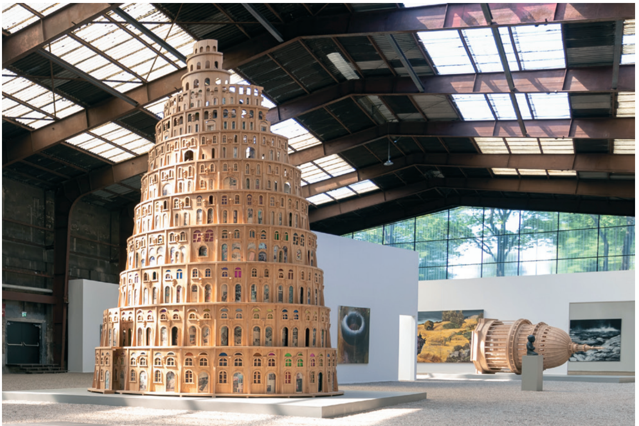
Babylonian, 2017–2018, Holz, Eisenträger, 750 x 500 x 500 cm • Parlamentsgebäude, 2017–2018, Holz, 520 x 220 x 220 cm Babylonian, 2017–2018, wood, iron girder, 750 x 500 x 500 cm • Parliament Building, 2017–2018, wood, 520 x 220 x 220 cm

1999 co-founds artists group "Mad for Real" with fellow Chinese artist CIA Yuan, attracting the attention of renowned British galleries by causing a big stir with their performances and interventions. "Two Artists Jump on Tracey Emin's Bed" and "Two Artists Piss on Duchamp's Urinal" (Tate Britain, 1999 and 2000) were anarchic art events that at the time ranked among the most provocative of their kind. 2006 Jackson Pollock Art Prize. 2016 China Phoenix Art Prize. Exhibitions in more than 25 countries. His works can be found in the collections of White Rabbit Gallery in Sydney, Ming Shen Bank in China and the British Museum in London. www.jianjunxi.com