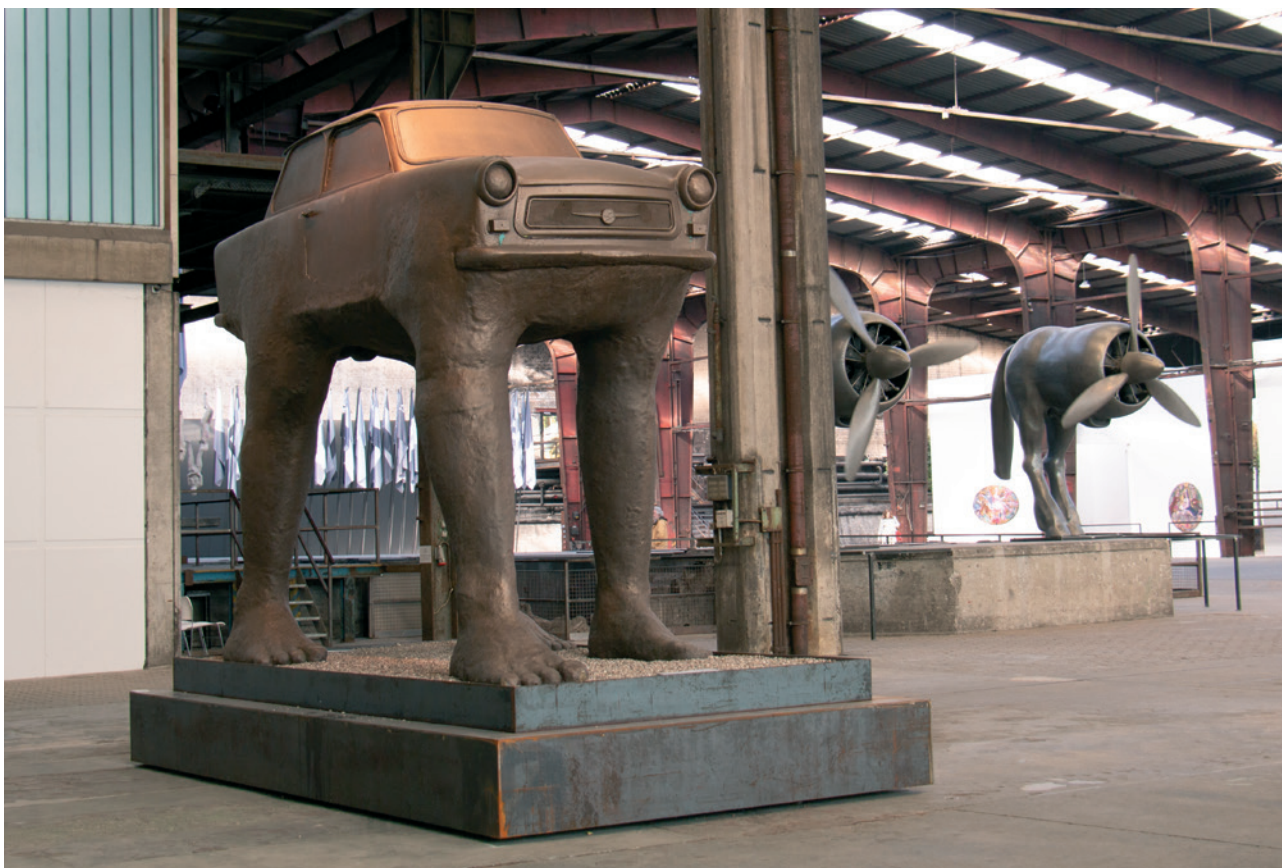
Quo Vadis, 1990, Fiberglas, Metall, 310 x 390 x 170 cm Quo Vadis, 1990, fiberglass, metal, 310 x 390 x 170 cm

At NordArt 2019, the original artwork became one of the exhibition's crowd pullers. Since the fall of the Berlin Wall and regarding the history of East and West Germany, the title of the work has remained relevant. For this reason, on the 3rd October 2019, "Quo Vadis" made a spectacular short trip from NordArt to Kiel, as a symbol of the courage of the DDR-refugees and the freedom, and was part of the German Unity Day Celebration. (Hanna Kremp)