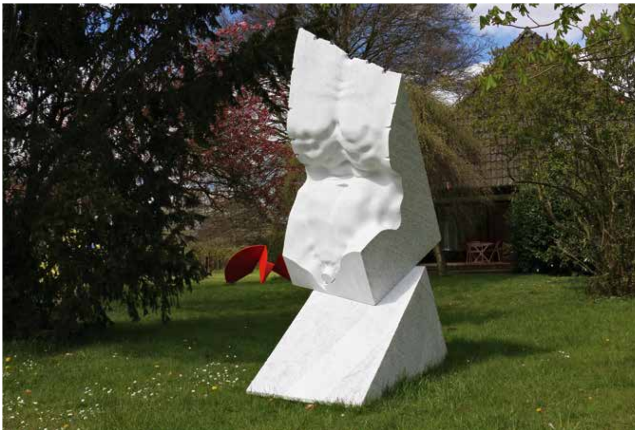
Echo der Antike , 2015, Carrara Marmor, 285 x 190 x 110 cm (Entstanden auf dem NordArt-Symposium 2015)

Born 1953 in Bulgaria. MA, National Academy of Fine Arts, Sofia. Diploma, Academy of Fine Arts, Carrara, Italy. 1979–94 Prof. for Sculpture, Academy of Fine Arts, Sofia. 2000–01 Prof. for Sculpture, Academy of Fine Arts, Carrara. 2007–09 Lectureship, Academy of Fine Arts, Sofia. Memberships: Society Piemonte Arte, Turin, Italy; Royal British Society of Sculptors ARBS, London; International Association of Art UBA, UNESCO; Artists Union CarrArte, Italy; Artists Union ASART, Pietrasanta, Italy. Winner of more than 20 international prizes for sculpture. NordArt Prize 2012. Numerous participations in international sculpture symposia, exhibitions and biennials worldwide. Numerous works in permanent exhibitions and private collections (selection): Sculpture Park Gallery, Shanghai; Tsinghua University, Beijing; Rose Garden Park, Taipei; Yuzi Paradise, Guilin; National Art Gallery, Sofia; Stone Museum Hualien. Monumental sculptures in public places (selection): Sofia, Berlin, Milan, Malta, Vermont, Beverly Hills (NJ), Istanbul, Dubai, Abu Dhabi, Wuhu, Urumqui, Qingdao. www.filinart.com