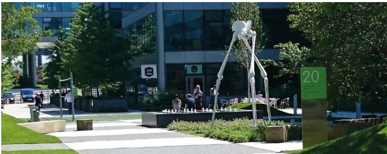
Dreibein, 2013, Polyesterharz, 400 x 190 x 190 cm