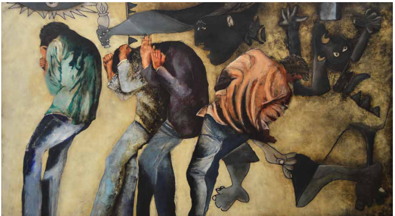
Vier junge Männer, vom Krieg bedroht (Paraphrase Detail / Fragmente nach Picasso: Guernica), 2014–2015, Acryl auf Leinwand, 110 x 200 cm Four young men threatened by war (Paraphrase detail / fragments after Picasso: Guernica), 2014–2015, acrylic on canvas, 110 x 200 cm

Born 1954 in Silkeborg, Denmark. Lives and works in Denmark and Spain. 1978–1980: Art History, Aarhus University – Art Appreciation, Silkeborg Seminarium. 1980–1982: Advertising illustrator and consultant. 1983–1990: Film producer, illustrator, designer and publisher. 1990–present: Established artist in Andalusia, Spain. Numerous solo exhibitions and decorative tasks in Denmark, the US, Spain, Sweden, Switzerland. www.carstenfrank.dk