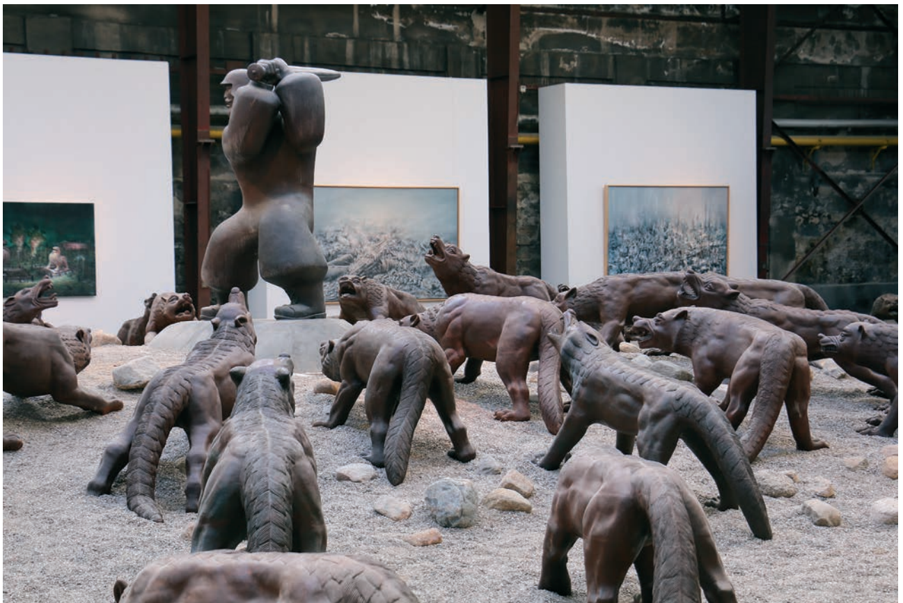
Wölfe kommen, 2008–2010, Stahlguss, 110-teilig, je 110 x 90 x 220 cm Wolves Coming, 2008–2010, casted steel, 110 parts, each 110 x 90 x 220 cm