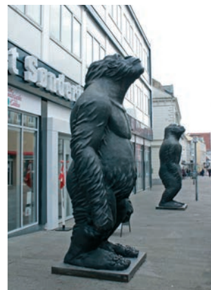
Erbssünde , 2011–2013, Bronze, 36-teilig, je 350 x 180 x 120 cm (Aufbau in der NordArt und in Sønderborg, Dänemark) Original Sin , 2011–2013, bronze, 36 parts, each 350 x 180 x 120 cm (set-up at NordArt and in Sønderborg, Denmark)