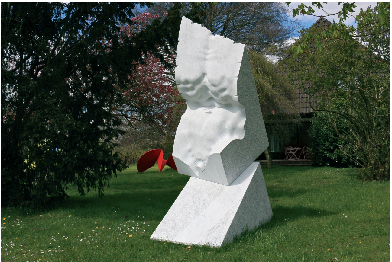
Echo der Antike, 2015, Carrara Marmor, 285 x 190 x 110 cm Echo of the Ancient, 2015, Carrara marble, 285 x 190 x 110 cm

Born 1953 in Bulgaria. MA, National Academy of Fine Arts, Sofia. Diploma, Academy of Fine Arts, Carrara, Italy. 1979–94 Prof. for Sculpture, Academy of Fine Arts, Sofia. 2000–01 Prof. for Sculpture, Academy of Fine Arts, Carrara. 2007–09 Lectureship, Academy of Fine Arts, Sofia. Memberships: Society Piemonte Arte, Turin, Italy; Royal British Society of Sculptors ARBS, London; International Association of Art UBA, UNESCO; Artists Union CarrArte, Italy; Artists Union ASART, Pietrasanta, Italy. Winner of 20 international prizes for sculpture. NordArt Prize 2012. Numerous participations in international sculpture symposia, exhibitions and biennials worldwide. Numerous works in permanent exhibitions and private collections (selection): Sculpture Park Gallery, Shanghai; Tsinghua University, Beijing; Rose Garden Park, Taipei; Yuzi Paradise, Guilin; National Art Gallery, Sofia; Stone Museum Hualien. Monumental sculptures in public places (selection): Sofia, Berlin, Milan, Malta, Vermont, Beverly Hills (NJ), Istanbul, Dubai, Abu Dhabi, Wuhu, Urumqui, Qingdao. www.filinart.com