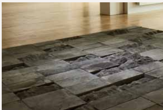
Tan Xun 谭勋