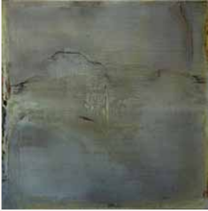
Guan Jingjing 关晶晶