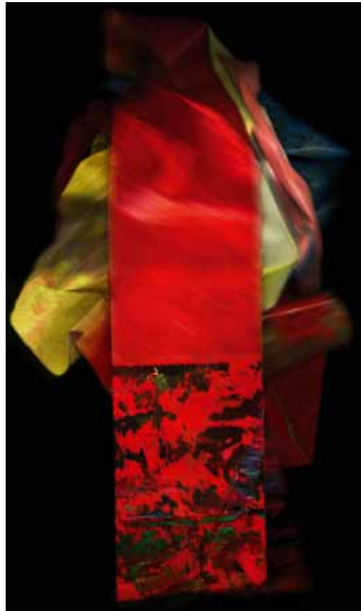
Unfold-2 / Unfold-5, 2011–2012, High End Photography auf Aludibond, je 120x60 cm Unfold-2 / Unfold-5, 2011–2012, High End Photography on aludibond, each 120x60 cm